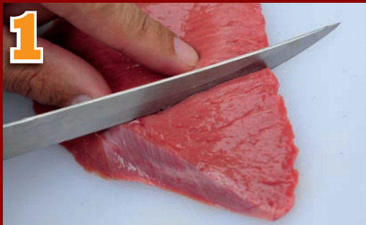
1 Coupez un petit morceau de viande.