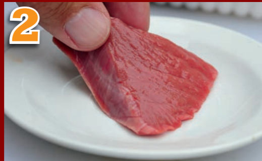
2 Placer ce morceau de viande dans une soucoupe.