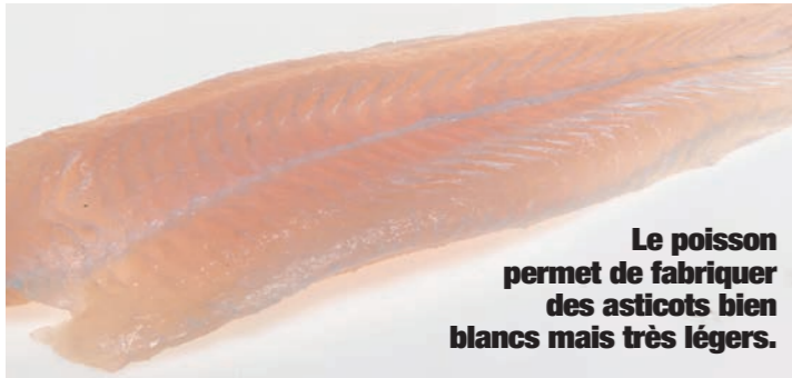
Le poisson permet de fabriquer des asticots bien blancs mais très légers.

Par Nicolas Bérout ( nicolasberoud@infopeche.fr )