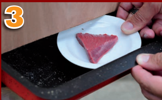
3 Poser la soucoupe au fond de la cage à mouches.